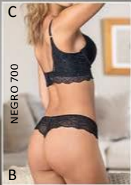
Bustier de doble push up. Sexy por delante, sexy por detrás.