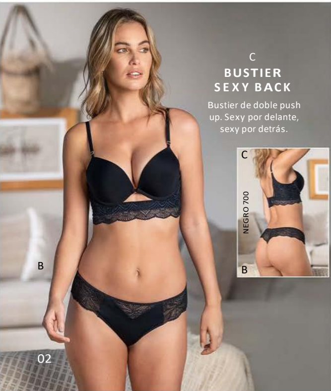
C BUSTIER SEXY BACK