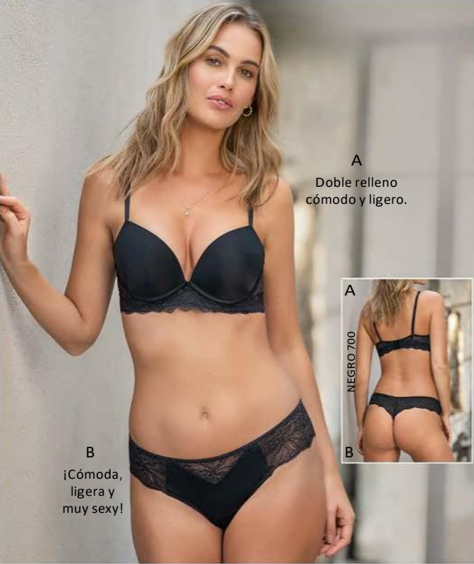
A Doble relleno cómodo y ligero.